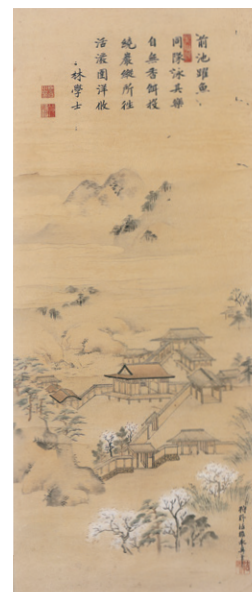
賛・林鷲峰 画・狩野安信 象頭山十二景図より<前池躍魚>