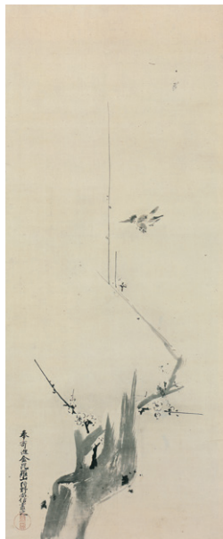
狩野尚信 出山釈迦並梅竹図