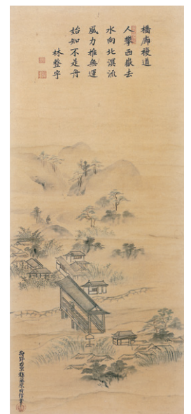
賛・林鳳岡 画・狩野時信 象頭山十二景図より<橋廊複道>