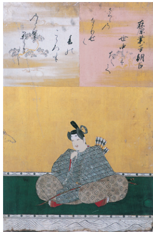
在原業平 書・青蓮院宮尊純法親王 画・狩野探幽