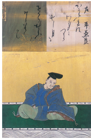
平兼盛 書・滋野井季吉 画・狩野尚信