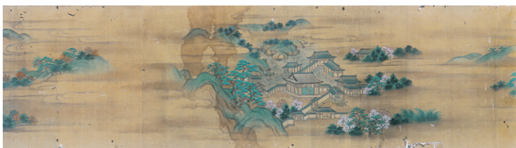
狩野常真 象頭山十二境図巻より<前池躍魚>