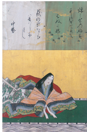
中務 書・坊城俊完 画・狩野安信